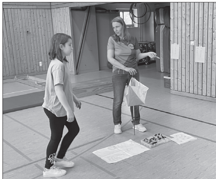
Sogenannte Orientierungspunkte mussten mit den Fingerchips registriert werden.