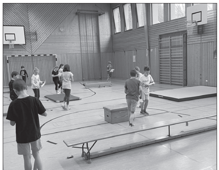
Die Fingerchips wurden natürlich fleißig in Anspruch genommen.