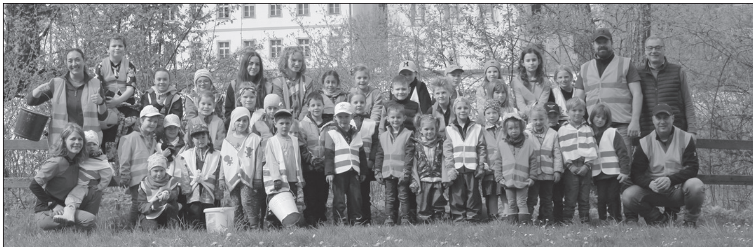
Über 40 Teilnehmer konnten jede Menge Müll einsammeln.