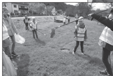
Der lustigste Fund überhaupt – zwei Unterhosen.