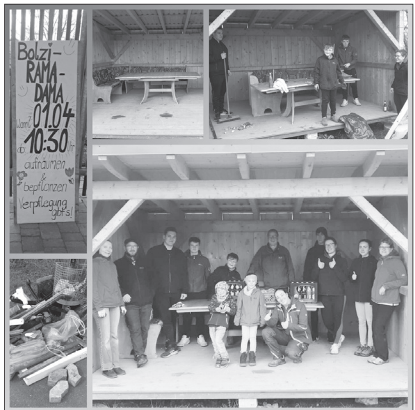
Die erste Aktion Rama Dama war bereits ein voller Erfolg!

Löschzuggeln von der Kinderfeuerwehr! Treffpunkt ist um 10 Uhr am Spielplatz in Pielenhofen!