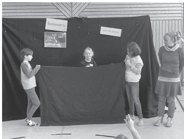
Auf dieser Bühne konnte man die Superkräfte messen und Optimismus lernen.