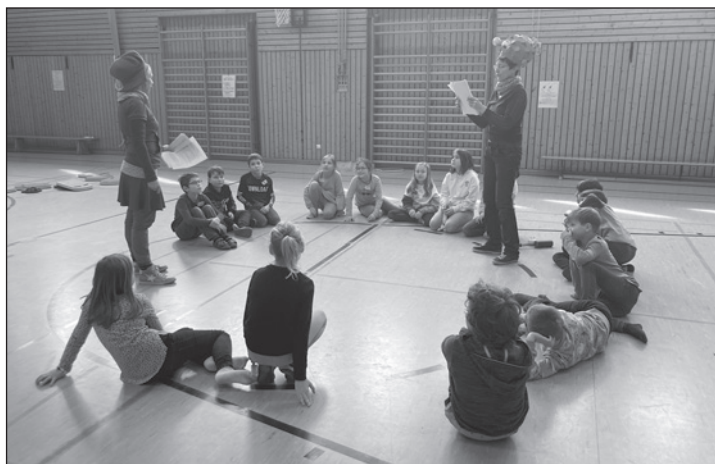
Die Kindern lernten durch Übungen ihre Stärken zu artikulieren.

Im ersten Modul lernten die Kinder durch Theaterszenen, Übungen und Spiele u.a. Selbstwahrnehmung und Fremdwahrnehmung kennen - und was das Gute daran ist, mitzubekommen, wie es mir selber geht. Dabei wurden sie eingeladen wie Rappeldu in sich hinein zu hören: mit einem bestimmten Hörrohr ihre Gedanken, ihr Herz oder ihren Bauch zu befragen. Außerdem taten sie es Brummfidel gleich und setzten eine Spezialbrille auf, um genauer wahrzunehmen, wie es dem Gegenüber gehen könnte. Neben der Beschreibung und Bedeutung von Gefühlen, lernten die Kinder durch Übungen ihre Stärken zu artikulieren. Begleitet wurden sie dabei von den sympathischen Theaterfiguren, deren Geschichte sie gebannt verfolgten. Denn auch diese durchlebten im Laufe des Workshops einen